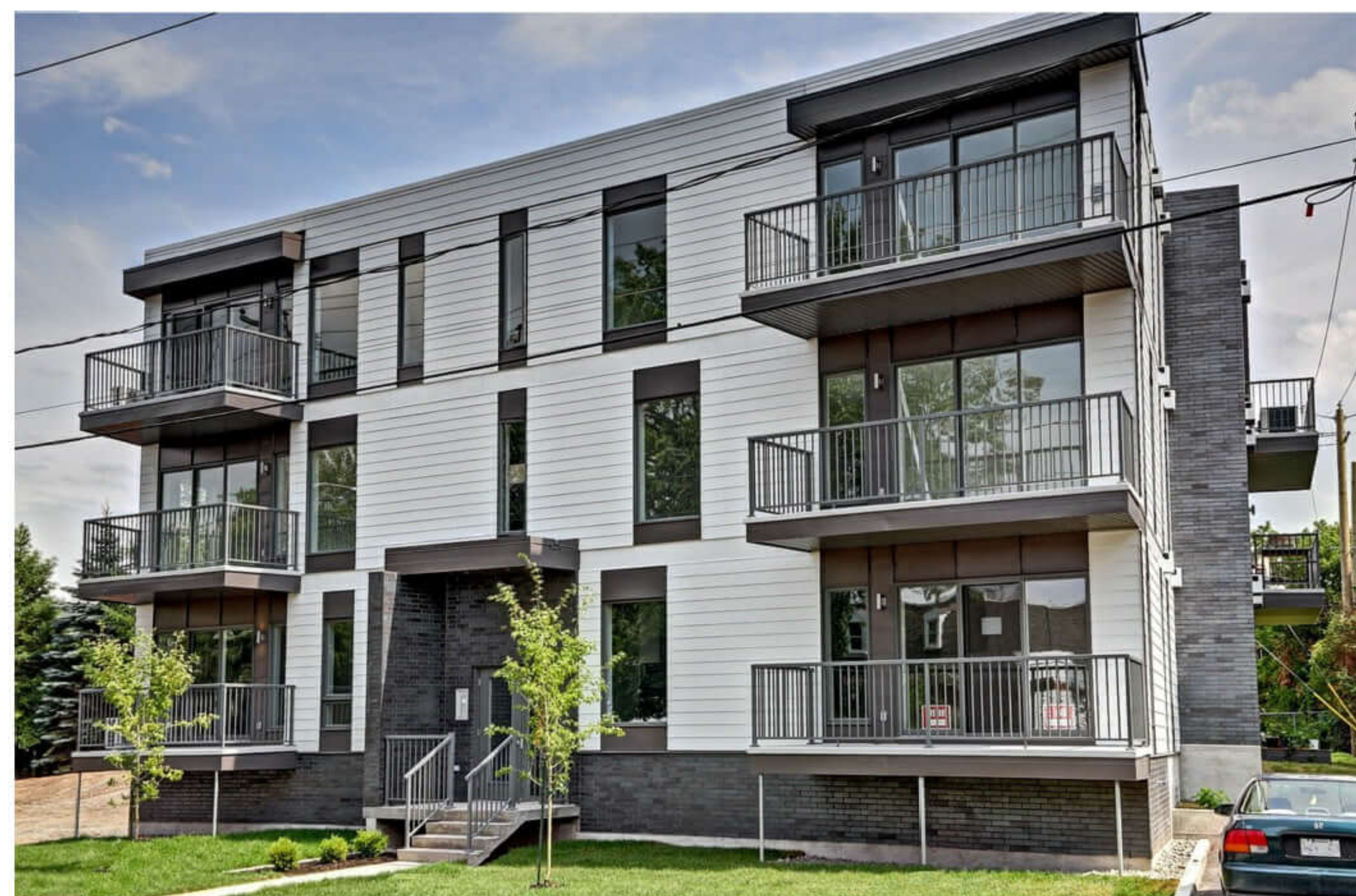
PHOTO DE LA PHASE 1