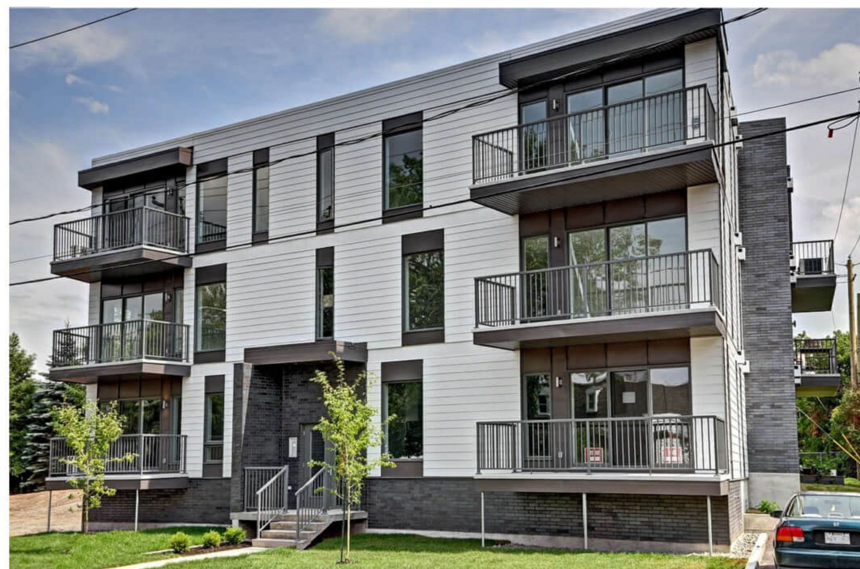
PHOTO DE LA PHASE 1