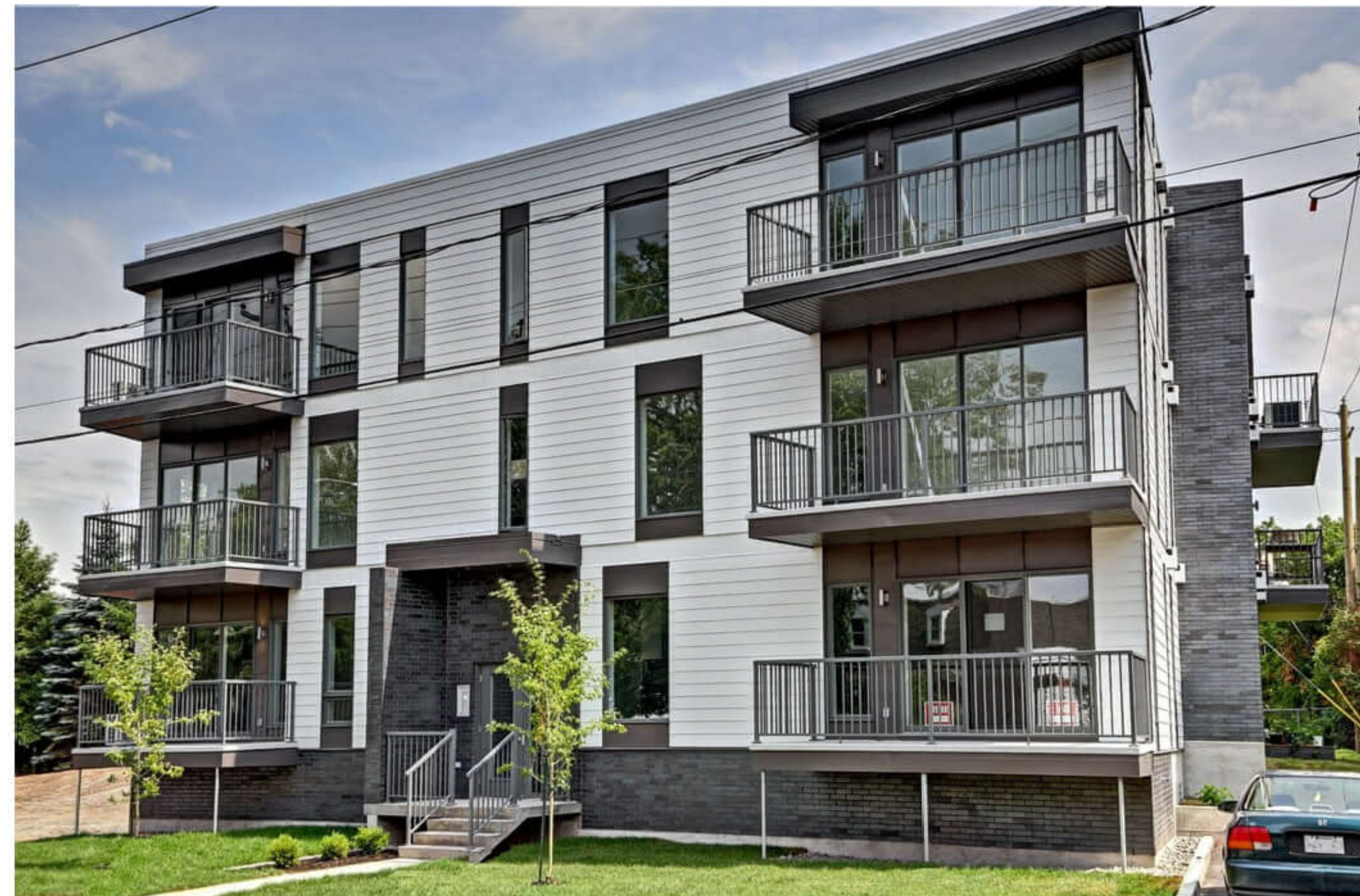
PHOTO DE LA PHASE I